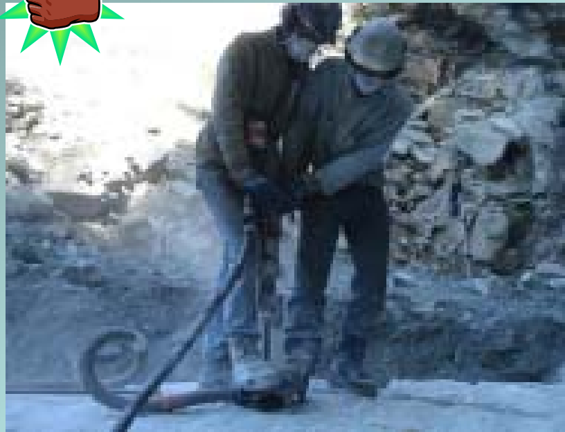
Perforazione con sistema di aspirazione a boccaforo