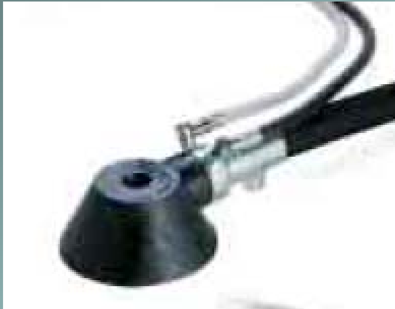
Cappello ad aria