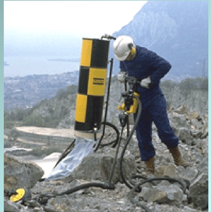
Ciclone di raccolta polveri