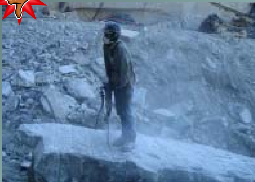
Perforazione senza aspirazione